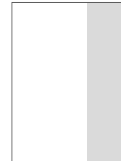
1/3 Seite hoch Breite: 75 mm Höhe: 297 mm