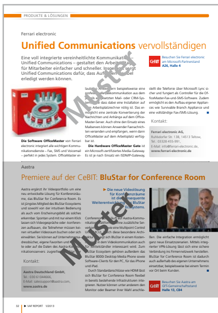
Beispiel für zwei Textbeiträge auf einer Seite im Bereich »Produkte & Lösungen«