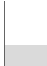
1/3 Seite quer Breite: 210 mm Höhe: 95 mm